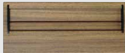
D-307JL (投入側) 塩ビシート貼り仕様

*フェイスオーダーは別途料金となりますので、当社スタッフまでお問い合わせください。