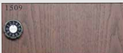
D-307JL (取出側) 塩ビシート貼り仕様

表面の質感や色調によって視覚的な印象は大きく変わります。ポストは、エントランスのトータルコーディネートを実現します。