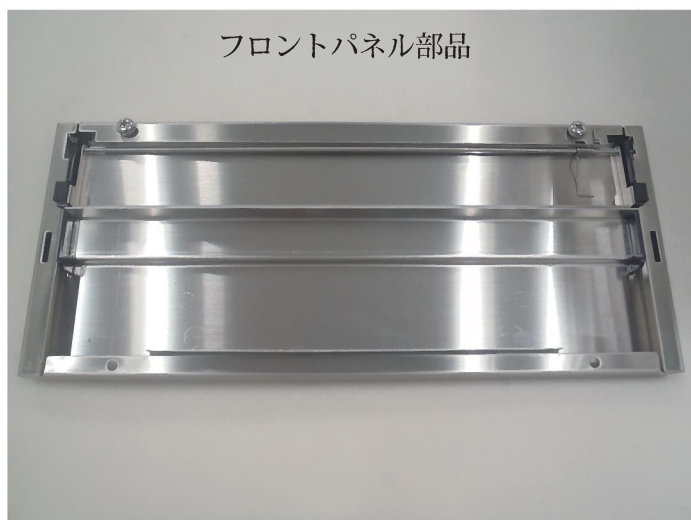
フロントパネル部品